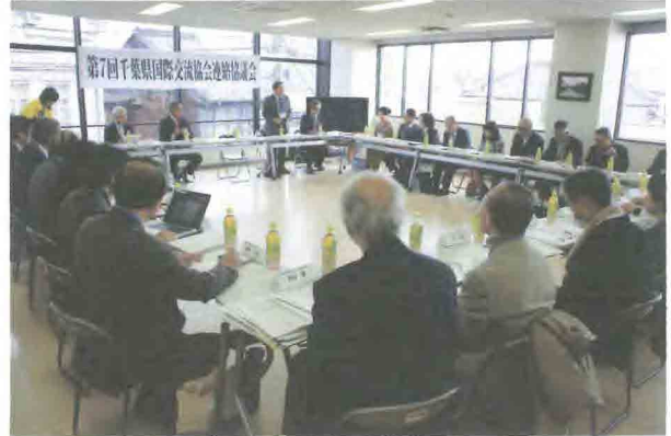
第7回千葉県国際交流協会連絡協議会の全体会