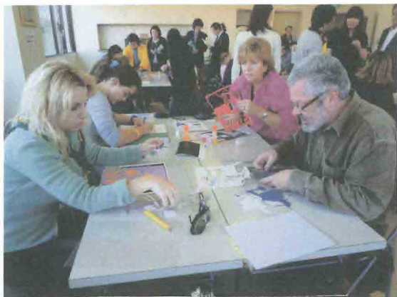
ギリシャからの学生訪問団の切り絵実習