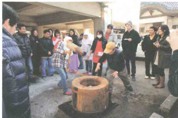
国際交流協会パーティで好評の餅つき