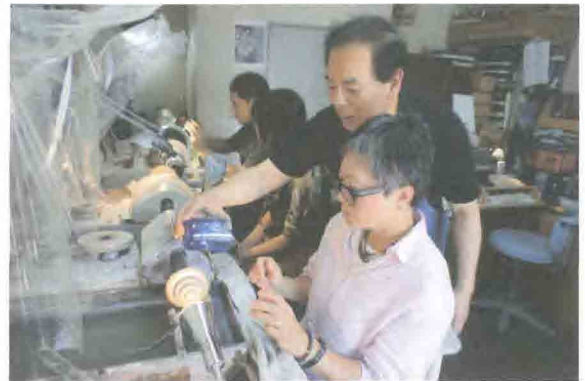
亀戸で江戸切子の実習

総務・研修部会：1月には千葉県災害時外国人サポーター養成講座(前期、後期)(市川市)、千葉県国際交流協会連絡協議会(八千代市)に参加しました。