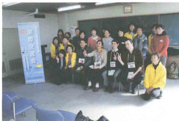
成田空港圏内教育支援の国際交流会・英会話