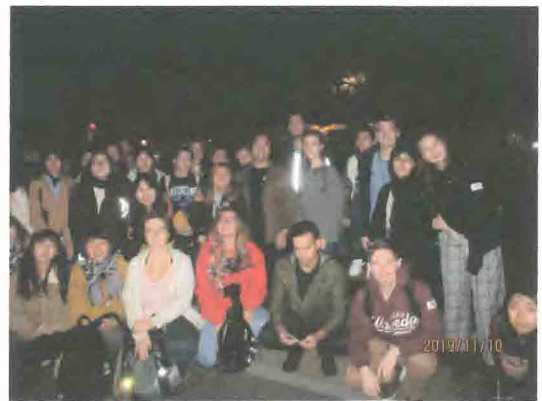
アフタダークになった早稲田大学留学生案内