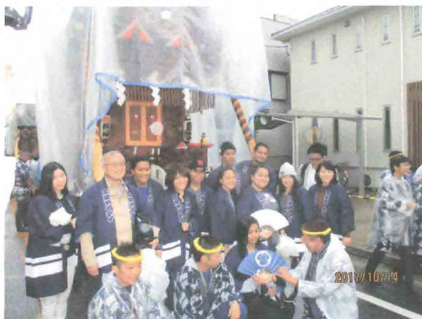
NID・上智大学留学生、秋の佐原の大祭にて