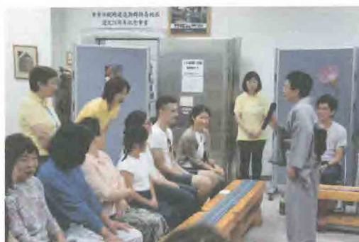
お茶を楽しむ会・外国人を接待する

交流部会：「英語でウォーキング」は令和元年6月15日(土)、あいにくの雨の中をリチャード先生とともに、小野川沿いのN