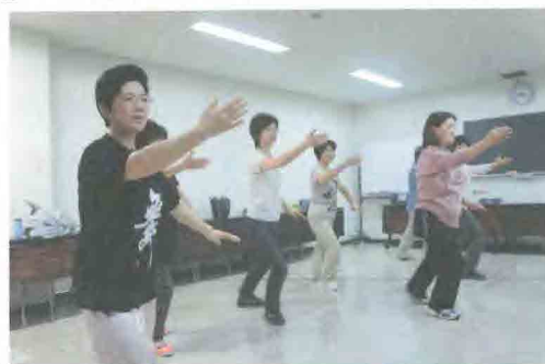
中国語・太極拳教室の練習風景

言語学習部会：中国語・太極拳教室は、土曜日、佐原公民館で行われています。いずれも同じ中国語ネイティブの先生に教えていただいています。中国語教室では、テキストを使って進めています。年に一度、全国区の中国語スピーチコンテストが行なわれ