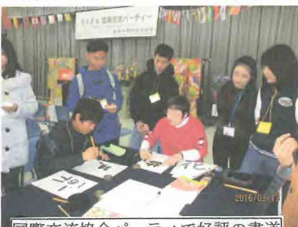
国際交流協会パーティで好評の書道

成田市で5年にわたって開催されてきた「成田空港圏日本語スピーチ大会」が終了して、北総圏内での大きな国際交流の機会が終わりましたが、平成28年3月13日に行われた KIFA 国際交流パーティーは第7回目となり、佐原商工会議所の大ホールに参加者が溢れんばかり、益々盛況になってきました。通訳ボランティア部会が行った通訳ガイドの延べ人数は422人となり延べ103人のガイドが対応したことになりました。平成28年2月には、佐原商工会議所の取り組んだ「外国人観光客誘客事業」にも協力しています。