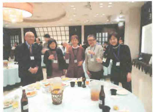
観光ボランティアガイド関東圏大会

2月には甲府市で開催された「観光ボランティアガイド関東圏大会」に参加した折、どの地域でも問題になっているのが「ボランティアの不足」でした。年々高齢化が進む中で、新メンバーの獲得が困難となっていて、その解決に頭を悩ませているのが現状を知りました。国際交流に対する興味と奉仕の気持ちを持つ新しいメンバーが増えてくれることが望まれます。