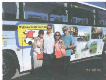
成田セレクトJRバスツアーのお客様さま

11月7日(水)には日本文化研修として、富岡八幡宮と江戸深川資料館を訪ねました。