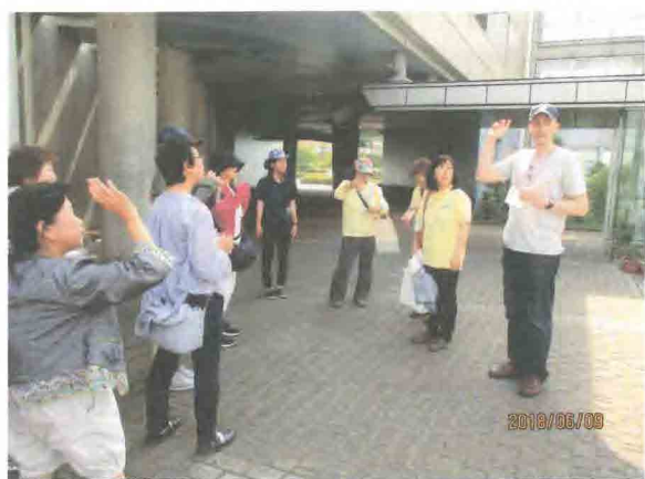
英語でウォーキング・水郷小見川少年自然の家にて

言語学習部会：「日本語ボランティア養成講座」も15年が経過し、「日本語を教える」ために知識のあ