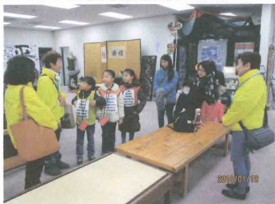
町並み案内を実習に来た小さな訪問者たち